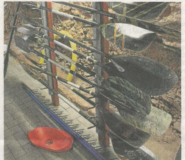
Unter der Turnhalle ist wieder das Gerätelager der Kanuten eingezogen.