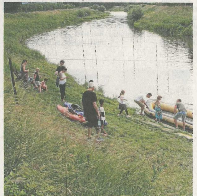
Kanuten luden während des Vereinsfestes auch zu Schlauchboot-Fahrten auf der Weißen Elster ein.